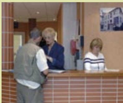
L'accueil du CCAS ouvert au public de 8h30 à 12h00 et de 13h00 à 17h00 du lundi au vendredi inclus.