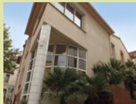
Le Centre Communal d'Action Sociale (CCAS) au 38 bis, rue Couvent de la Merci, place du Saré à PERPIGNAN.

- vendredi 08h30-11h30 - Tél : 04 68 34 44 53.